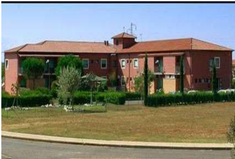
Unità Operativa di Cecina